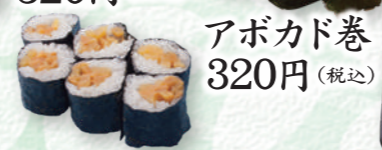
アボカド巻 320円 (税込)