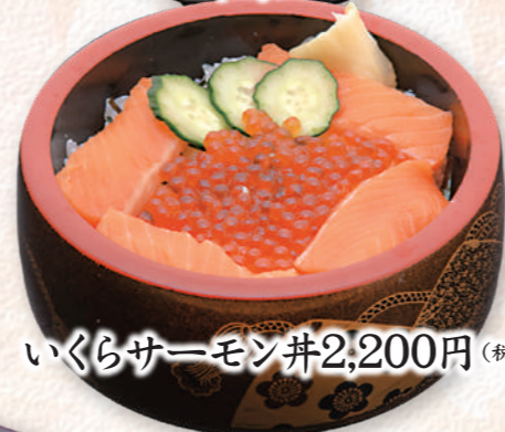
いくらサーモン井 2,200円 (税込)