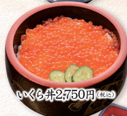
いくら井 2,750円 (税込)