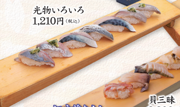
光物いろいろ 1,210円 (税込)