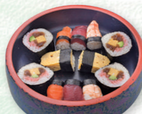
お子様寿司わかめ ..... 990円 (税込)