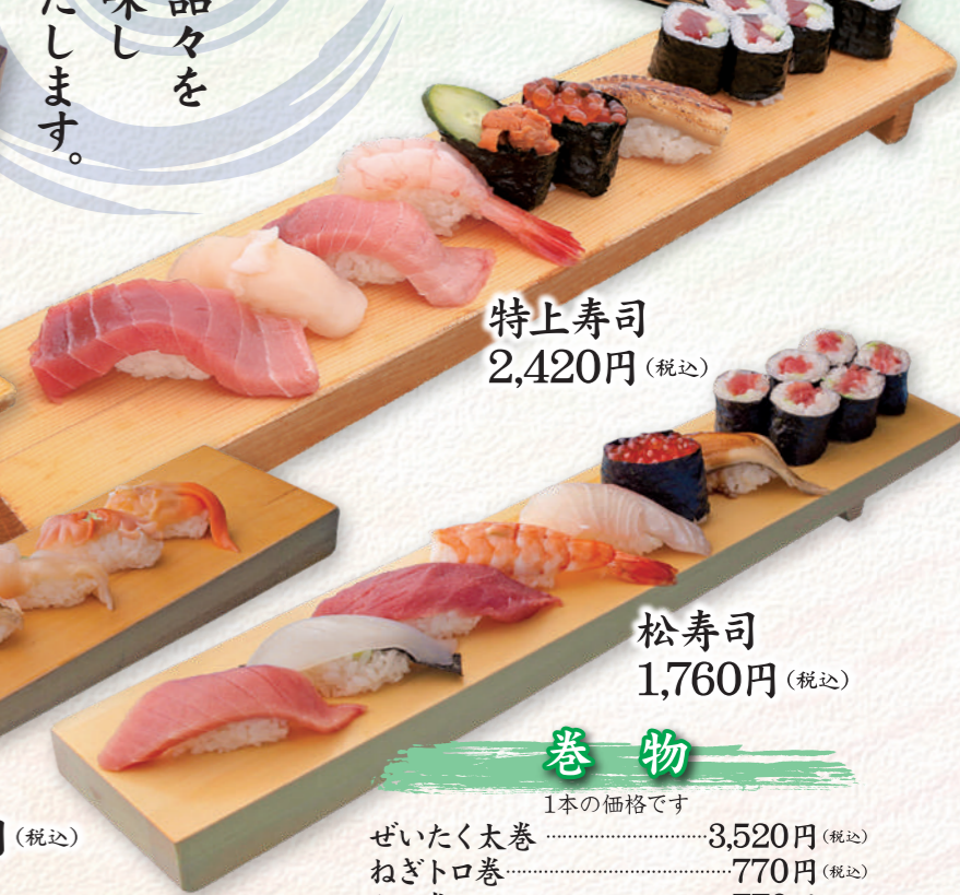
特上寿司 2,420円 (税込)