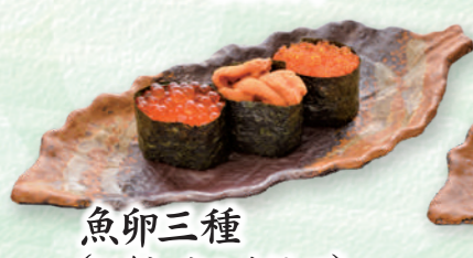
魚卵三種 (いくら・ウニ・トビッコ) ..... 990円 (税込)