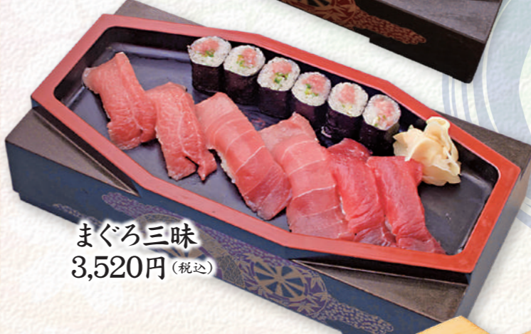
まぐろ三味 3,520円 (税込)