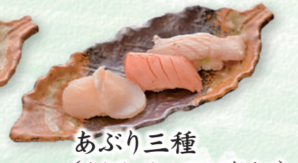
あぶり三種 (ホタテ・サーモン・びんトロ) ..... 660円 (税込)