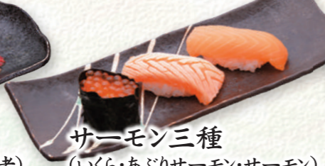
サーモン三種 (いくら・あぶりサーモン・サーモン) ..... 610円 (税込)