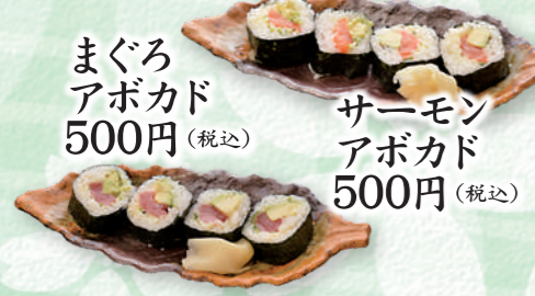
まぐろアボカド 500円 (税込)