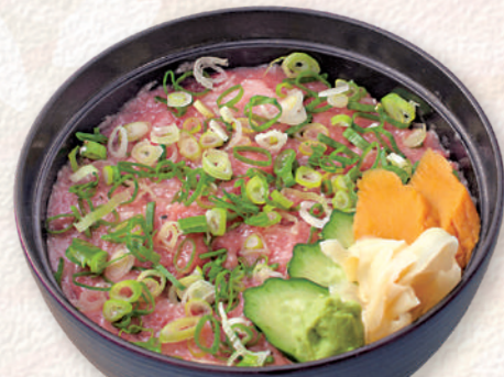
ねぎトロ井 2,530円 (税込)