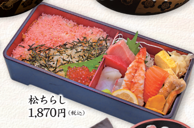
松ちらし 1,870円 (税込)