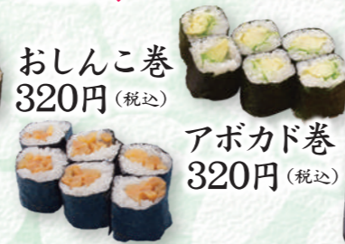
おしんこ巻 320円 (税込)