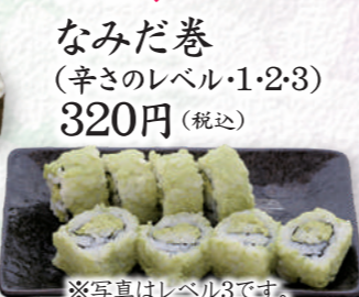
なみだ巻 (辛さのレベル1・2・3) 320円 (税込)