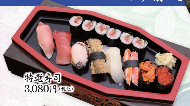
特選寿司 3,080円 (税込)