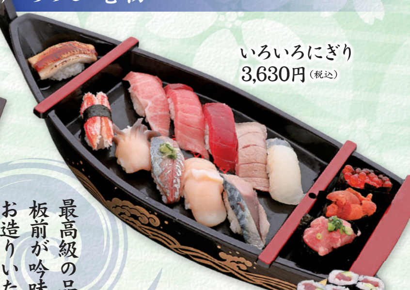
いろいろにぎり 3,630円 (税込)