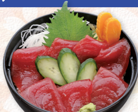
鉄火井 1,650円 (税込)