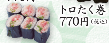
トロたく巻 770円 (税込)