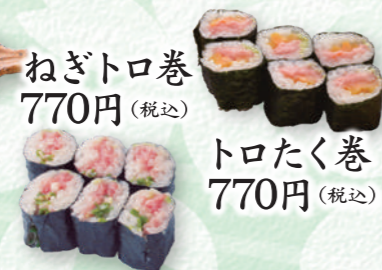
ねぎトロ巻 770円 (税込)