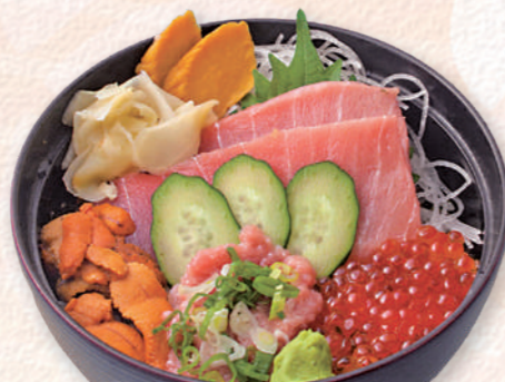
華井 3,080円 (税込)