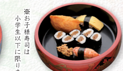
お子様寿司たら ..... 770円 (税込)