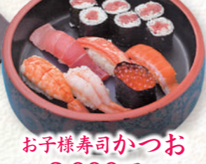
お子様寿司かつお ..... 2,090円 (税込)