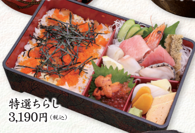
特選ちらし 3,190円 (税込)