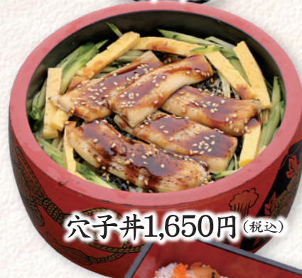
穴子井 1,650円 (税込)