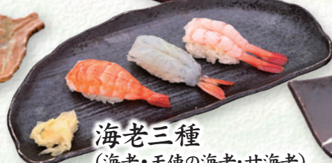
海老三種 (海老・天使の海老・甘海老) ..... 770円 (税込)