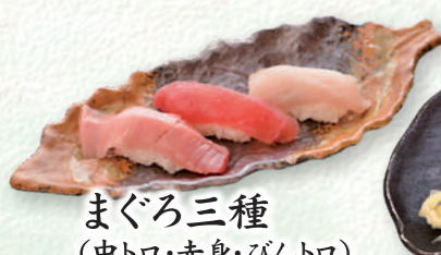
まぐろ三種 (中トロ・赤身・びんトロ) ..... 880円 (税込)